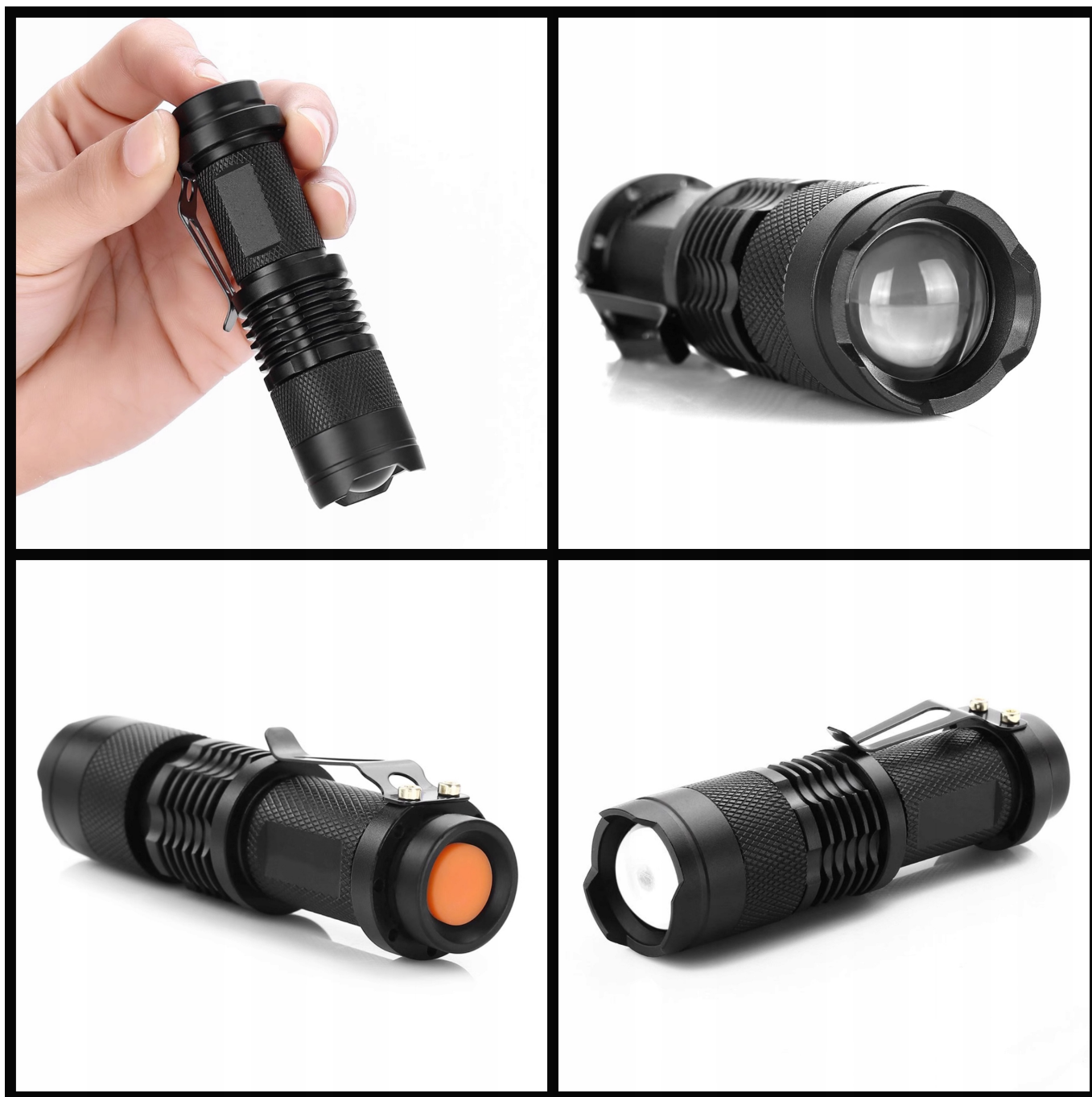
ALUMINIOWA LATARKA LED ZOOM