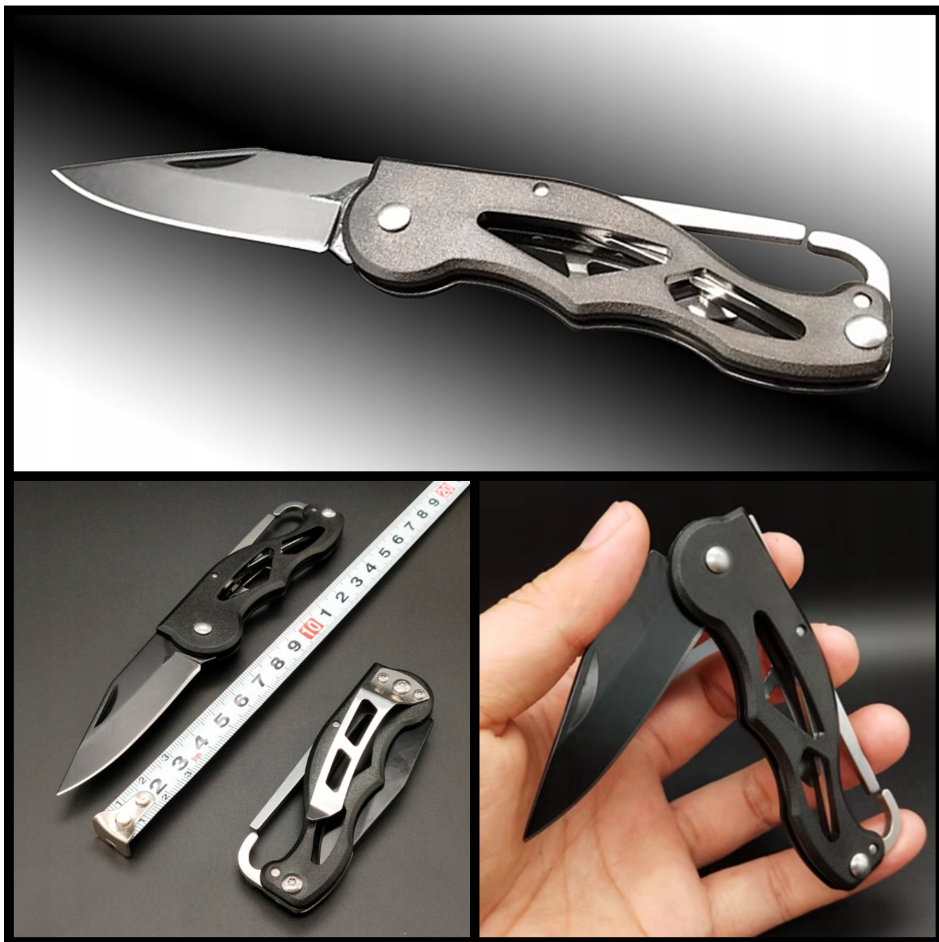
SKŁADANY NÓŻ Z BLOKADĄ