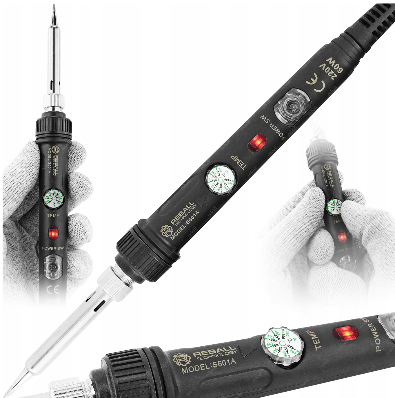
FIRMOWA LUTOWNICA REBALL S601A

Poradnik w wersji elektronicznej PDF wysyłamy po zakupie.