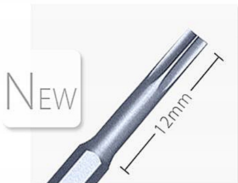
Deep hole working bits