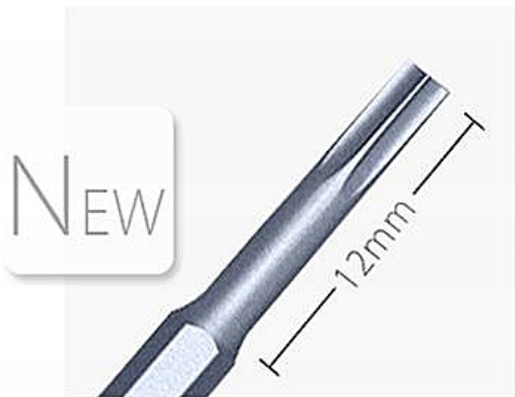
Deep hole working bits