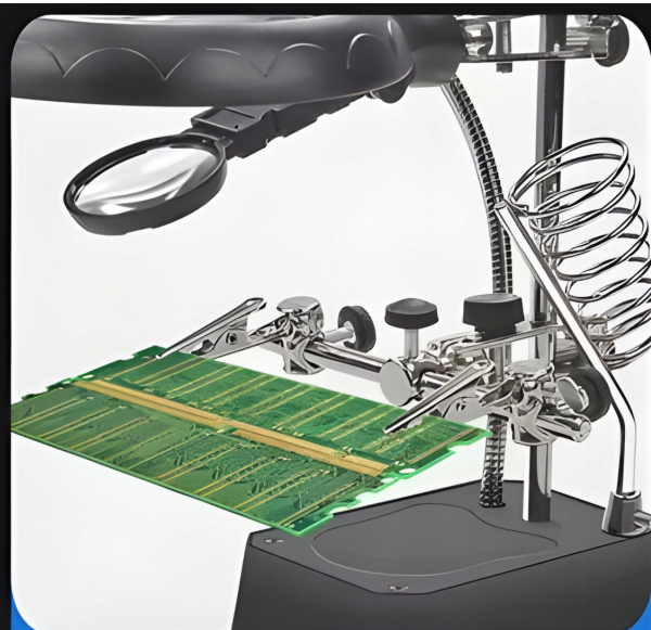
• Motherboard Repair