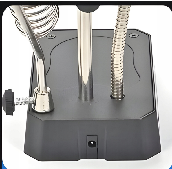
• USB plug