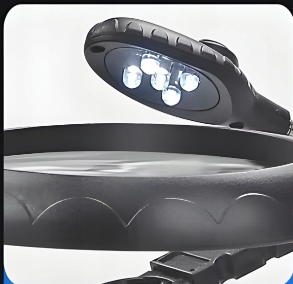
• LED energy-saving lamps