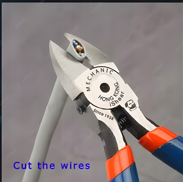
Cut the wires