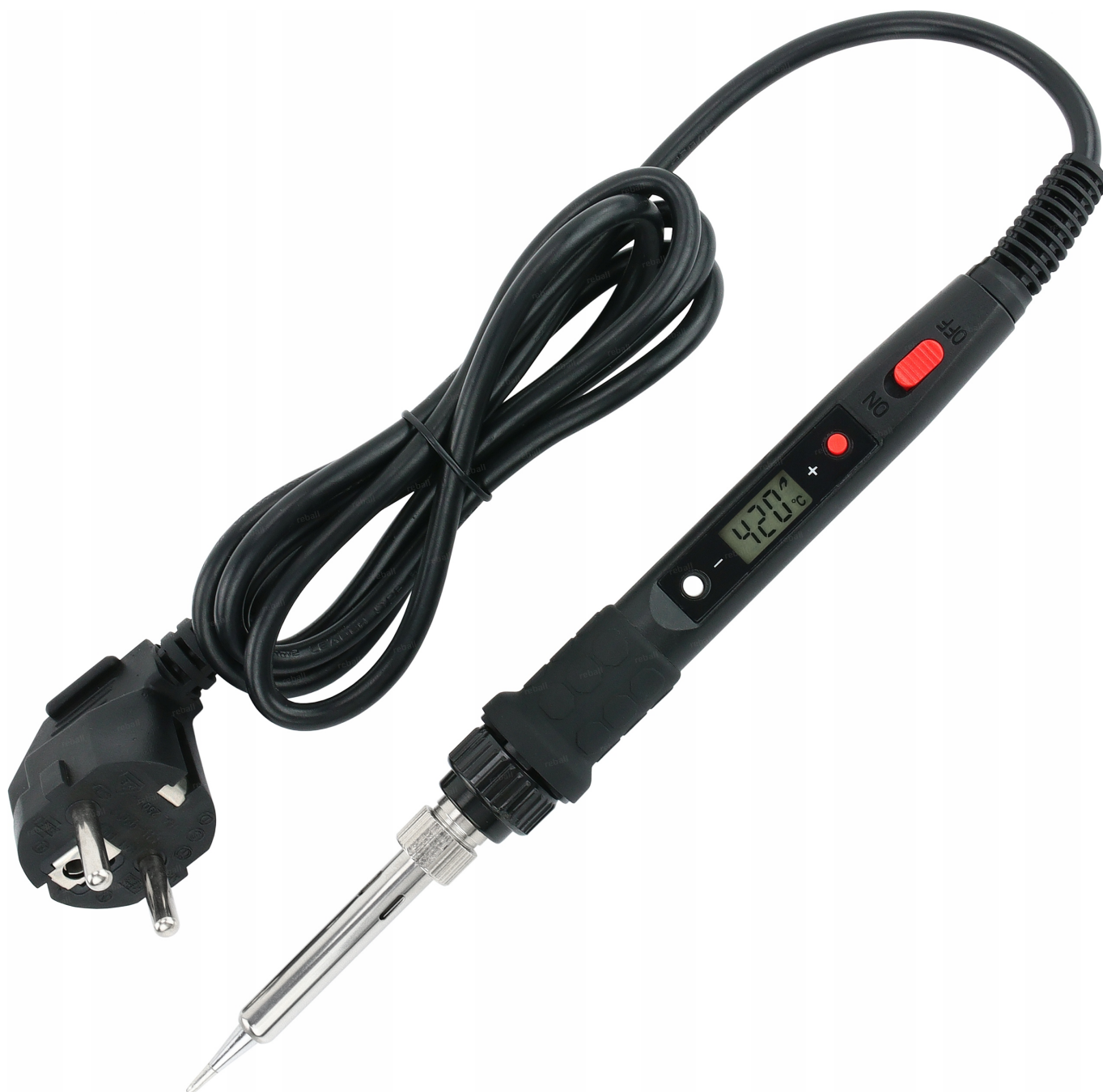
LUTOWNICA FIRMOWA REBALL S801A

Poradnik w wersji elektronicznej PDF wysyłamy po zakupie.