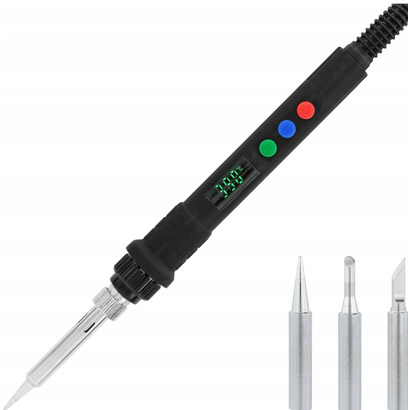
LUTOWNICA KOLBOWA REBALL S801B

Poradnik w wersji elektronicznej PDF wysyłamy po zakupie.