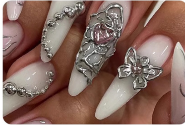
Builder Nail Gel