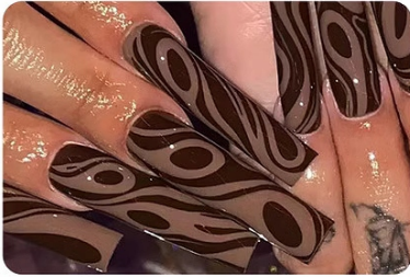
Liner Gel Nail Polish

This flexible U V/LED nail lamp supports all types of nail gels.