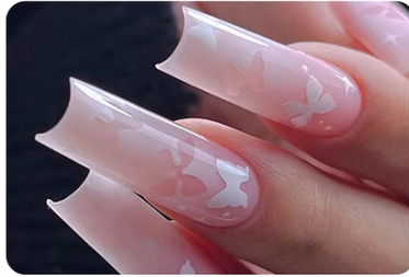
Different Nail Art