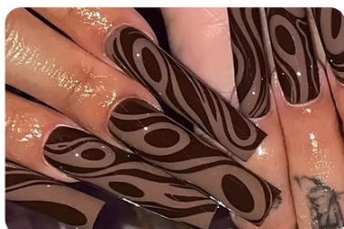
Liner Gel Nail Polish

This flexible U V/LED nail lamp supports all types of nail gels.