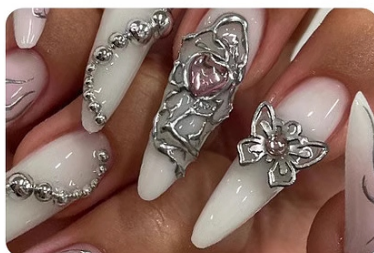
Builder Nail Gel