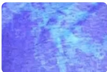
Fluorescent agent detection