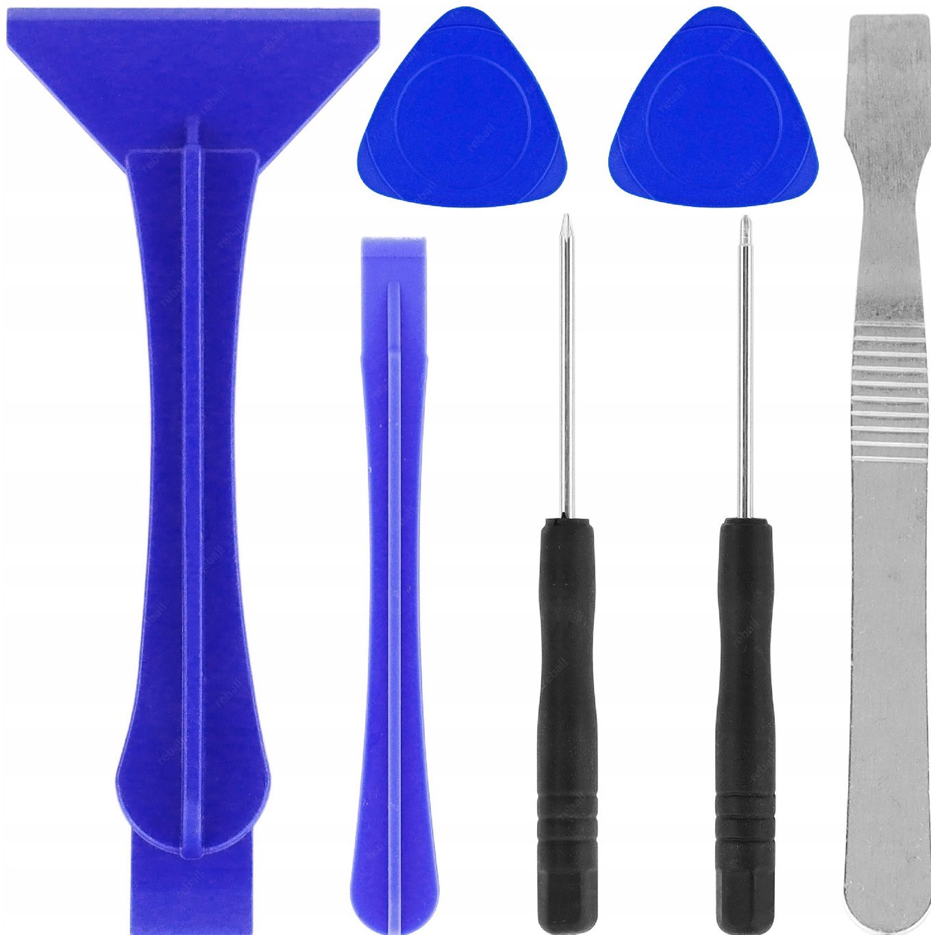
ZESTAW NARZĘDZI RT0207 - 7 EL.