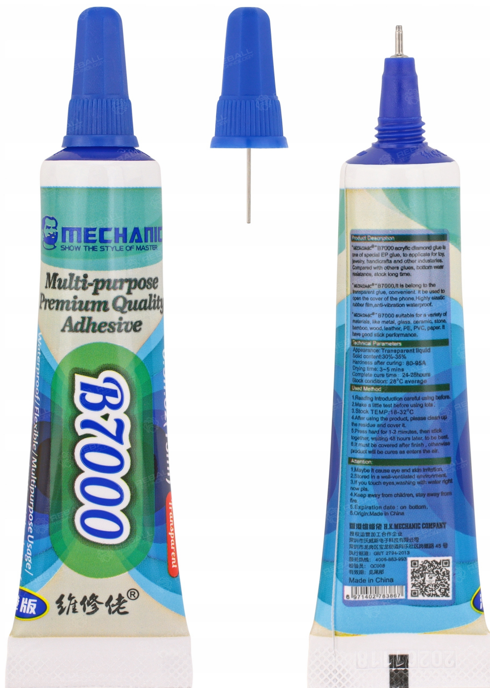
KLEJ MECHANIC B7000 HQ 15ml